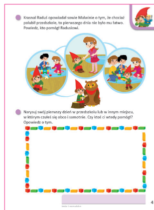
Kraina emocji, karta 4