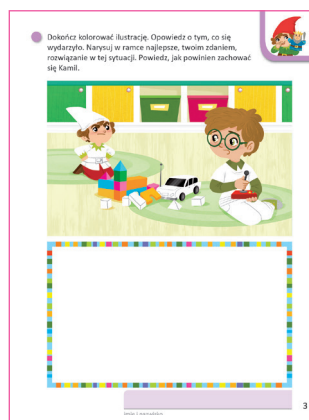
Kraina emocji, karta 3

N. wygrywa rytm na tamburynie, dzieci swobodnie poruszają się w pobliżu N. i postępują zgodnie z jego poleceniami: