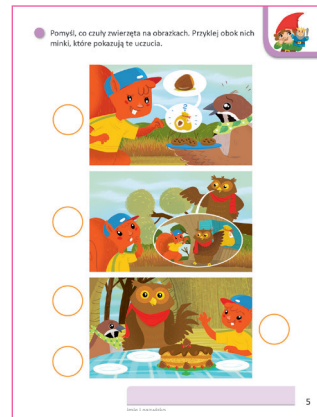
Kraina emocji, karta 5